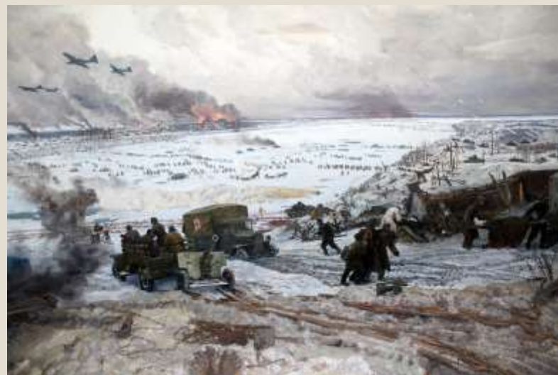
«БЕЛИКАЯ ПОВЕДА ОДЕРЖАНА СОВЕТСКИМИ ВОЙСКАМИ ПОД ЛЕНИНГРАДОМ: